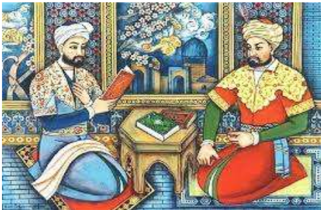
5-расм. Девоний Хусаний. Шарқ китобат санъати.

йўли хикоялари» ва бошқа кўпгина китобларни Китобат санъати усулида нафис безаклар, тасвирлар билан безатиб тайёрлаган.