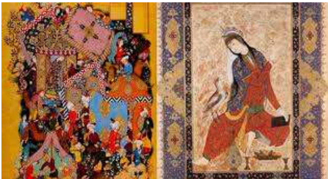
3-расм. Китобга ишланган мириатюралар.

қилиниб, миниатюралар билан безатилган юзга яқин қўлёзма ва мураққаълар авайлаб сақланмоқда. Тўпқопу саройи музейида сақланаётган «Шоҳнома», Низомийнинг «Ҳамса»си, юз варак, 650 суратдан иборат.