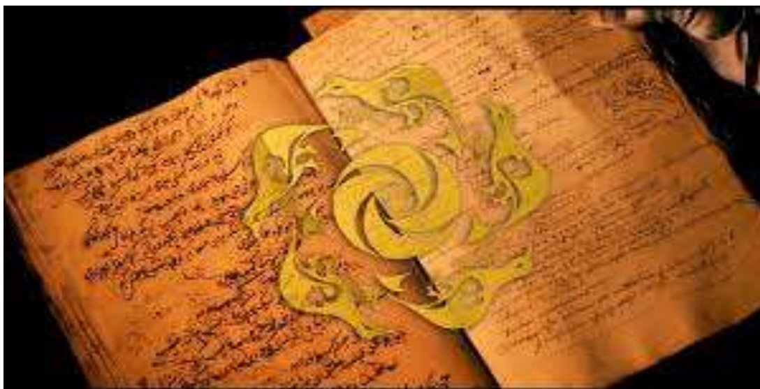
1-расм. XVIII - XIX асрларда китобат санъати.

Қўлёзма китоб учун яхши, сифатли қоғоз танланган, хаттот маттни қоғозга ёзишда махсус қоғоз-картон (мистар) устига ип тортиб унинг изини матн ёзиладиган қоғозга тушириб олгандан сўнг хат ёзилган. Маттни жойлаштирилиши хаттотнинг маҳоратига боғлиқ бўлган. Битилган маттни лаввоҳ ҳошия қоғозга елимлаган. Устидан жадвалкаш айна ёпиштирилган жойдан турли рангларда чизиқлар тортиб, маттни жадвалга олган. Сўнгра мўзаҳҳиб суюлтирилган олтин ва бошқа турли ранглар ёрдамида қўлёзмани зийнатлаган ва «шамс», «лавҳа», «сарлавҳа», «зарварақ» «хотима» сўзлари нақшлар билан безаган. Бўш қолдирилган жойларга мусаввир расм (миниатюра) ишлаган. Бойсунқур Мирзо альбоми, Амир Темур ва теурийзодалар суратларидан иборат мураккаблар, Баҳром Мирзо альбоми ва ўнлаб Улуғбек Мирзо ва Султон Ҳусайн Мирзо муҳрлари чекилган қўлёзмалар шулар жумласидандир.