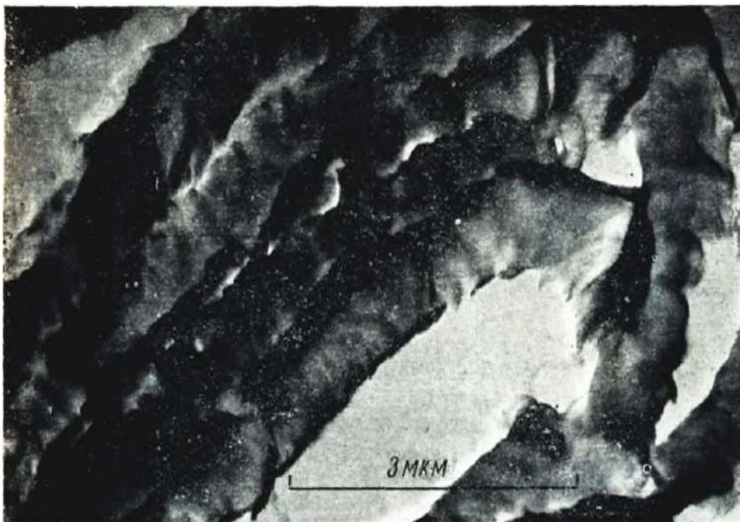
1.2.1–расм. 20 кунлик тола иккиламчи девори микрофибрилл қатламлари структураси