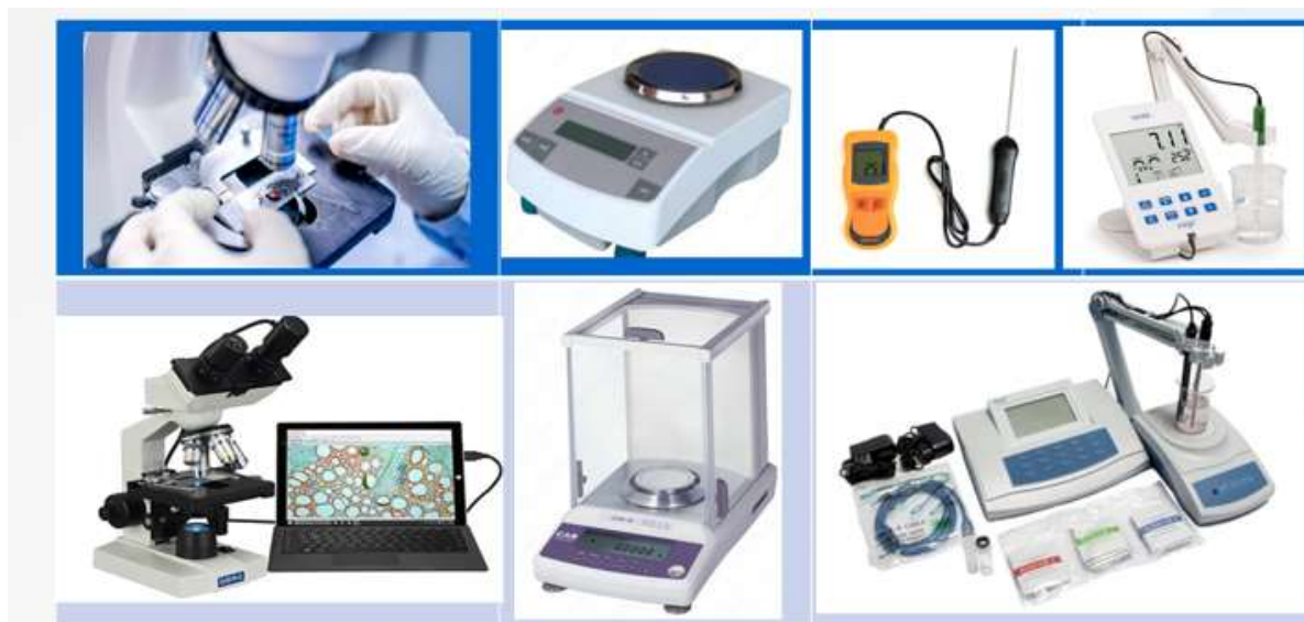
1-rasm. Raqamli laboratoriya jihozlari.

punktlari soni, barqarorlik mezonlari, harorat birliklari va boshqalar. Ma'lumotlar USB aloqa interfeyslari yordamida kompyuter yoki printeriga uzatilishi mumkin.