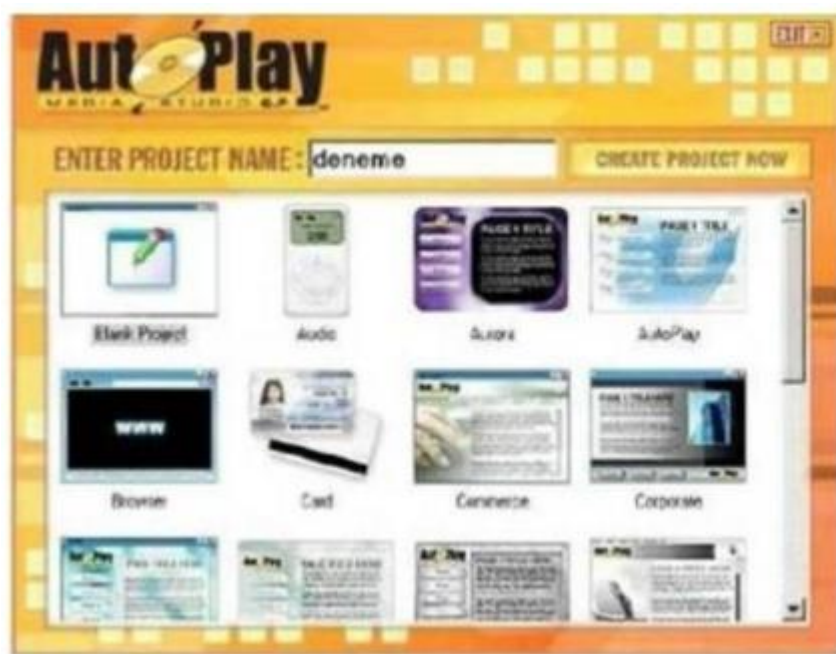
2-rasm. Loyiha shablonlarini tanlashga oid muloqot oynasi.

Shunday qilib, yuqoridagi taklifga binoan biz "Creat a new project" bandini tanlasak, u holda bir nechta yangi loyiha shablonlarini taklif etishdan iborat quyidagi muloqot oynasi yuzaga keladi (2-rasm):